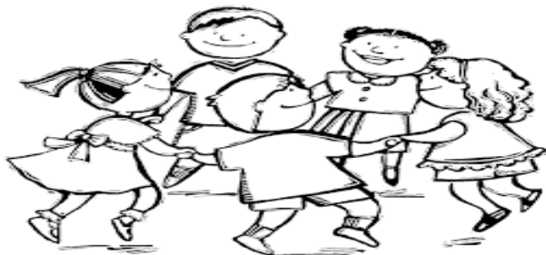
diritto al gioco