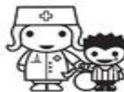
diritto alle cure