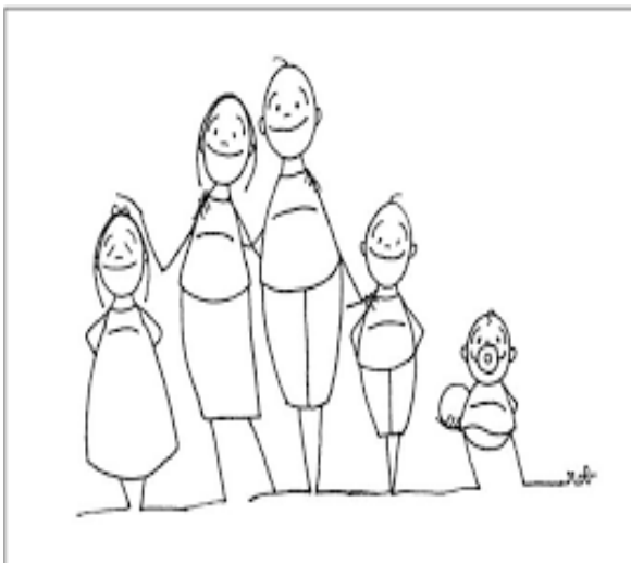
diritto alla famiglia