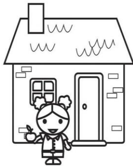
Diritto ad una casa