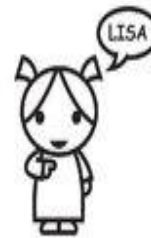
diritto al nome